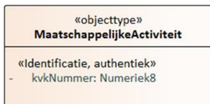
Figuur 3: Gegevensmodel productgegevens

Hieronder staan de gegevens beschreven conform de [Gegevenscatalogus]. De vetgedrukte objecten en gegevensgroepen behoren tot de gegevens van het product. De overige informatie wordt geleverd om de relatie en context van deze gegevens aan te duiden.